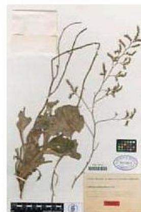
VAL-78731-1-Limonium santapolense Erben