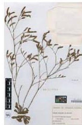
VAL-142412-1-Limonium interjectum Soler & Rosselló