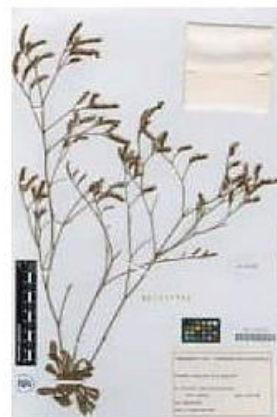
VAL-142412-1-Limonium interjectum Soler & Rosselló