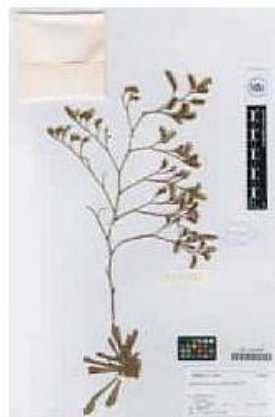
VAL-101609-1-Limonium interjectum Soler & Rosselló