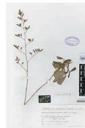
VAL-81832-1-Limonium ejulabilis Rosselló, Mus & J. X.