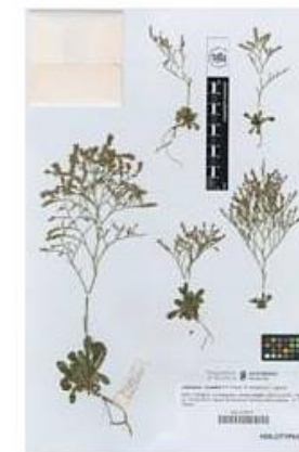
VAL-212371-1-Limonium rosselloi P.P. Ferrer, R. Roselló & E. Laguna