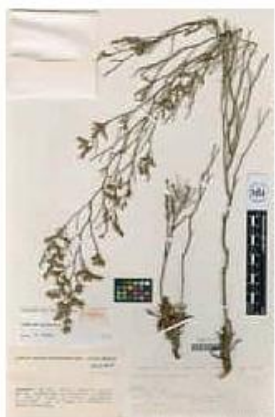
VAL-73172-1-Limonium ugijarense Erben