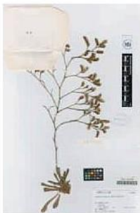
VAL-101609-1-Limonium interjectum Soler & Rosselló