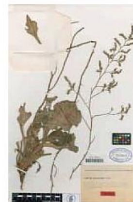
VAL-78731-1-Limonium santapolense Erben