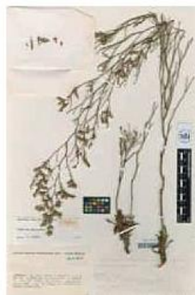
VAL-73172-1-Limonium ugijarense Erben